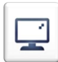
Pantalla full color TFT